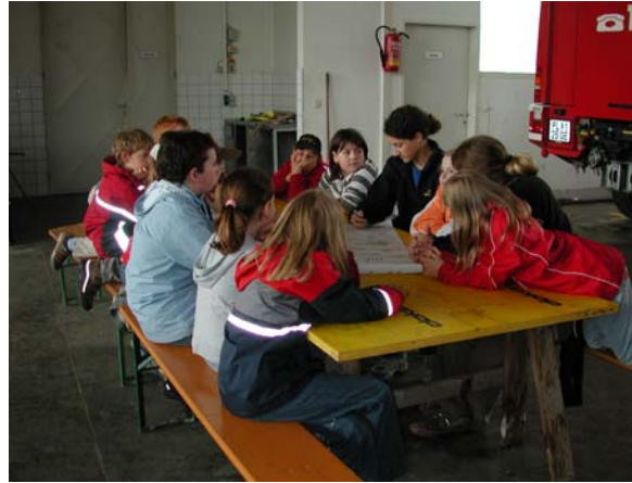
Die Spielforscher in Prinzersdorf